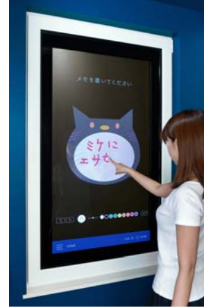
窓をキャンパスにして お絵かきやメモする生活の伝言板