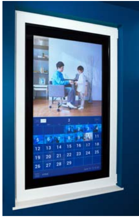
窓が毎日の生活を記録して 行動パターンに応じ窓を自動開閉