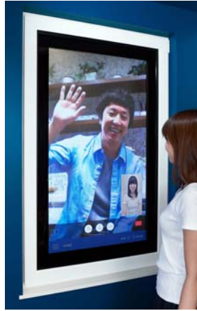
お互いの窓越しに 離れた家族と一緒に団欒