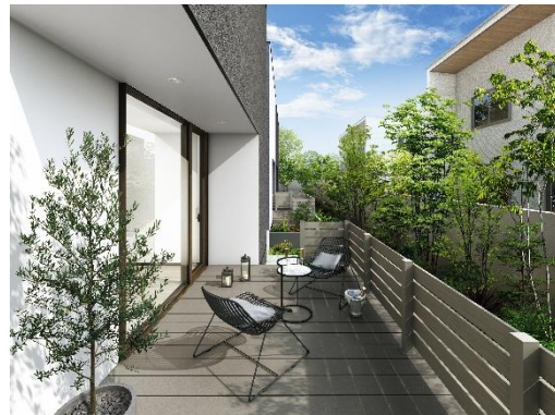
（左）高意匠タイプ「リウッドデッキ S EG」、（右）スタンダードタイプ「リウッドデッキ S」

近年、シンプルで効率的な生活を送ることができる平屋住宅への関心や、既存住宅のリフォーム、リノベーション需要が高まっており、費用を抑えながら多様なライフスタイルを反映した住宅選びが行われています。また、庭回りを生活空間と捉えて、フェンスやデッキ、植栽を設けてアウトドアリビング化するなどのエクステリアリフォームの事例も増えています。