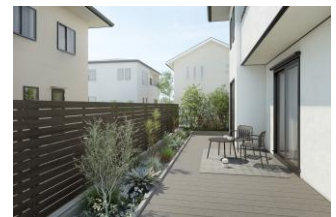
エクステリアリフォーム例 （上）Before、（下）After

「リウッドデッキ S EG」「リウッドデッキ S」はデッキ材の板厚を増やし、剛性を上げながら熱反りにも配慮した仕様にする事で、従来品と比較して大引・束柱などの部材点数を削減。これにより2間6尺（横幅約3.6m、奥行約1.8m）サイズでは従来品と比較して施工時間を約1時間短縮し、価格比約93%を実現しました。意匠面ではキャップ部品の小型化や質感の向上を図り、洗練した外観に仕上げています。従来品と同様に素材は木粉とポリプロピレン（※1）とし、耐候性・耐腐朽性・耐水性を確保しながら、滑りにくさ、デッキ材のすき間にモノが落ちない構造など、リウッドデッキの特長を生かしています。